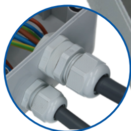
M25-wartel inclusief vergroting