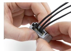
Vergrendeling veilig sluiten.