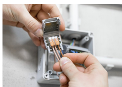
Aangesloten klem in de gelbox plaatsen.