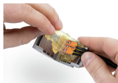
Opnieuw toegankelijk: Gelbox openen Gel verwijderen Opnieuw bedraden met nieuwe componenten